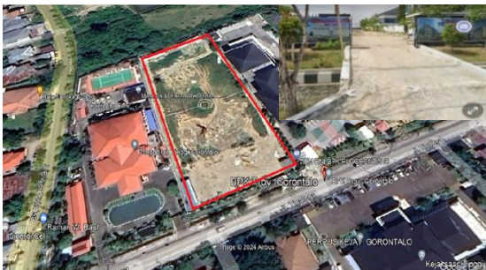
Gambar 1. Lokasi Penelitian

Penelitian dilakukan pada proyek pembangunan Rusun BPK RI Kota Gorontalo di Jl. Tinaloga No.3, Dulomo Selatan, Kecamatan. Kota Utara, Kota Gorontalo, Provinsi Gorontalo yang lebih jelasnya, lokasi penelitian dapat ditunjukkan pada Gambar 1.